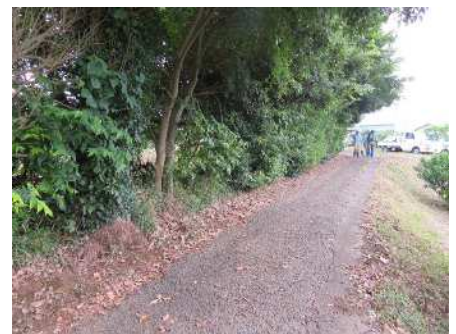
田畑の周辺にひそみ場が・・・