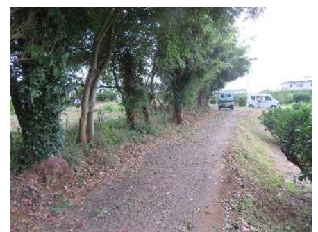
刈払い、間伐で見通し良く！