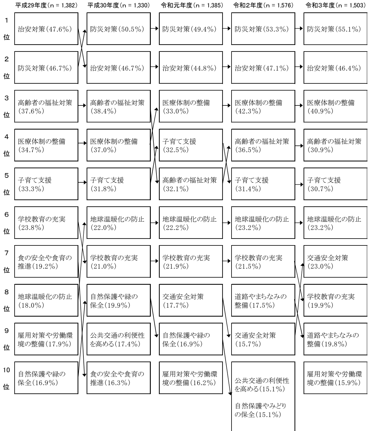
図表4-2 県行政への要望（上位10項目）（複数回答）－過去との比較

過去の調査と比較すると、上位6項目は前回調査と同様になった。前回調査で第9位であった「交通安全対策」が第7位、第7位であった「学校教育の充実」が第8位となった。上位5項目は、平成29年度以降同じ項目となっている。(図表4-2)