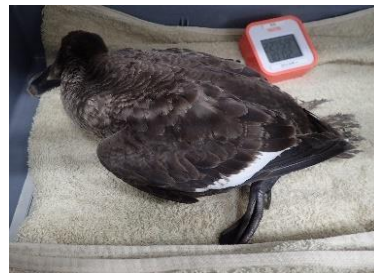
ビロードキンクロ