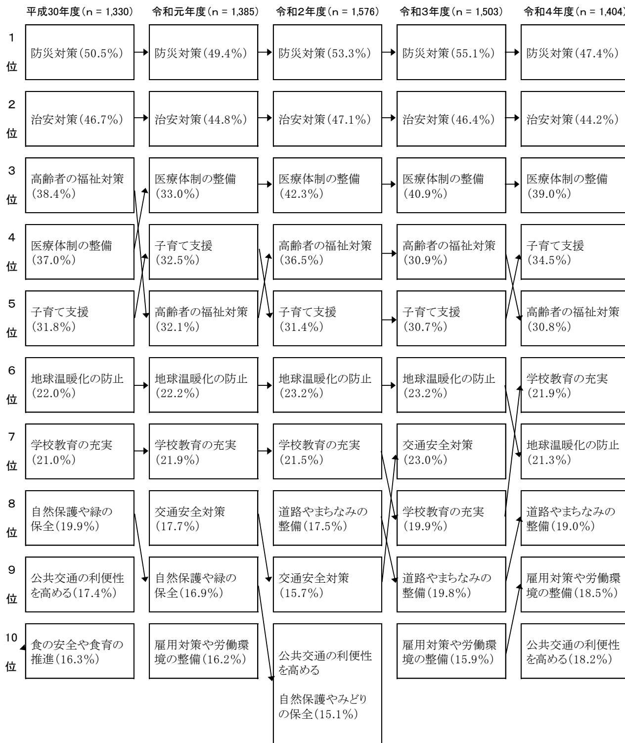
図表4-2 県行政への要望（上位10項目）（複数回答）－過去との比較

過去の調査と比較すると、上位3項目は前回調査と同様になった。前回調査で第4位であった「高齢者の福祉対策」が第5位、第5位であった「子育て支援」が第4位となった。上位5項目は、平成30年度以降同じ項目となっている。(図表4-2)