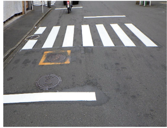
【道路標示の補修前と補修後】